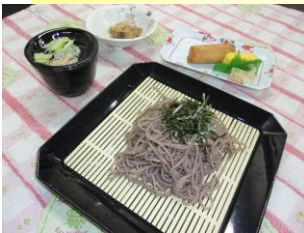
ざるそば・ざるうどん

エネルギー 590/601kcal たんぱく質 22.2/15.7g 脂質 9.3/8.3g 塩分 4.9/5.1g